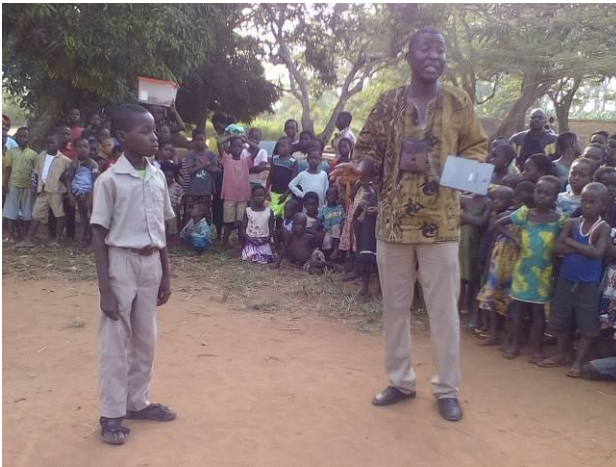
Sensibilisation à Gblinvié (Zio)