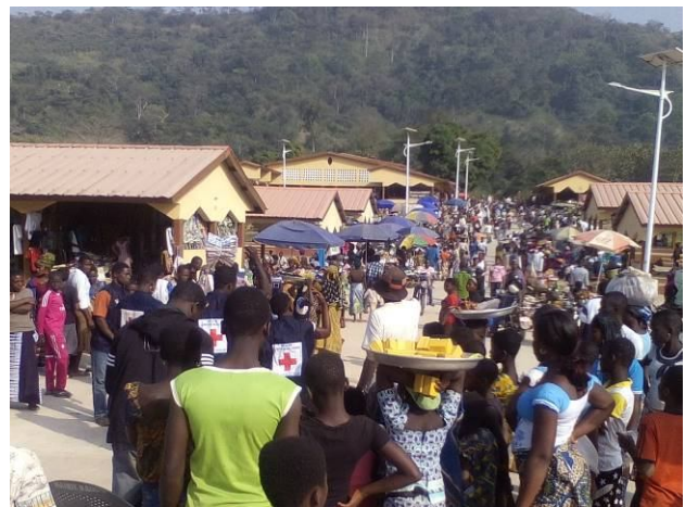
Sensibilisation au marché de Badou (Wawa)