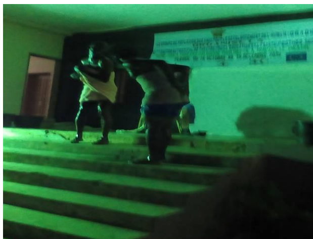
Intermède par Cie Kadam Kadam