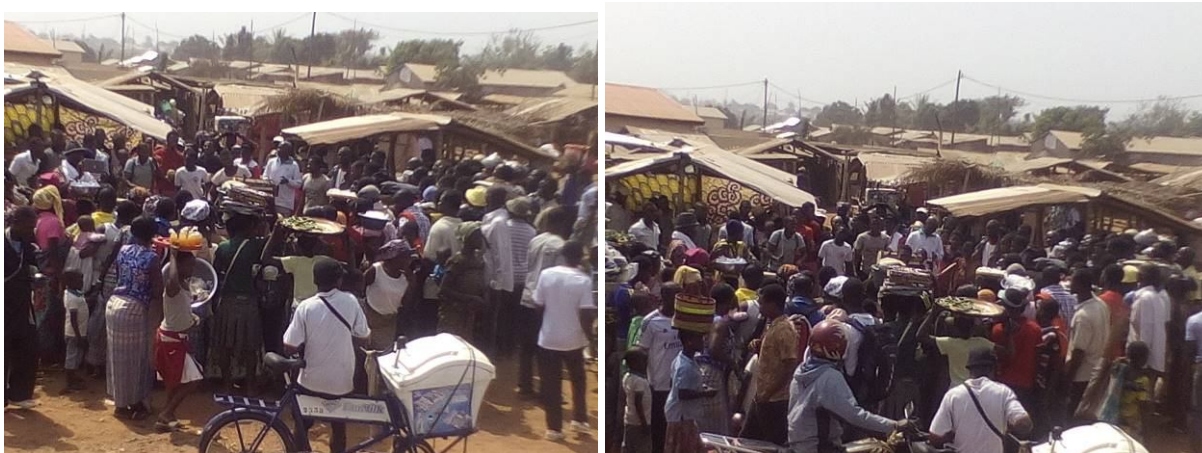
Image de la sensibilisation au marché d'Agbonou

Cette sensibilisation a permis de toucher environ 5 000 personnes