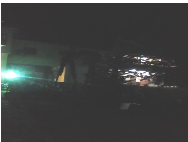
Démonstration des échassiers d'Atakpamé