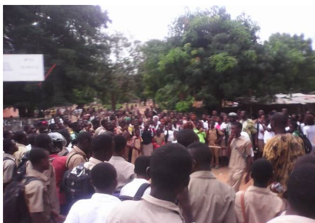
Représentation théâtrale devant le Lycée

Les personnes touchées au cours de ces représentations de rues sont estimées à 1080 (niveau rail : 150 personnes, niveau Lycée Agbonou : 400 personnes, niveau CCA : 110 personnes, niveau grand marché : 420 personnes)