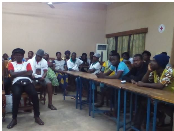
Images des participants à l'AG du 19 décembre à Atakpamé