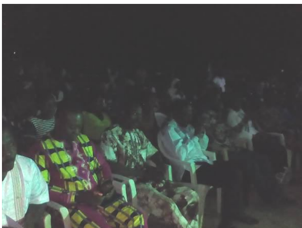
Autorités à la cérémonie de clôture

Au cours de la cérémonie de clôture, un des porteur du projet du FAC a eu à faire visualiser son film intitulé l'amour étrangler.