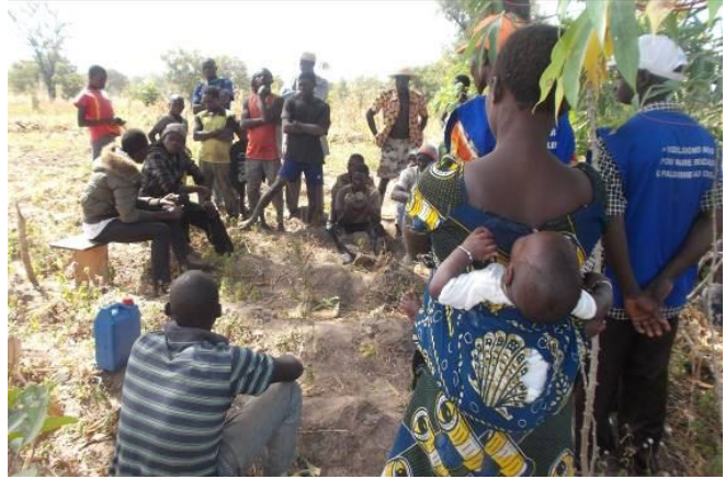
Sensibilisation à Koudjoukada (Kozah)