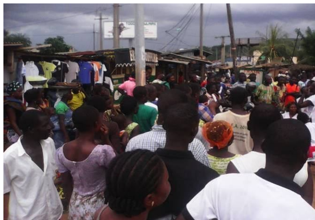
Représentation dans l'ancien marché Agbonou